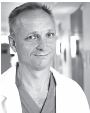
Brännström (képünkön), a göteborgi egyetem docense vezette.

A műtétet nemzetközi orvoscsoporthoz tartozó orvosok végezték el. Az ikertestvérek egyik tagja méhrel született, és már három gyermeknek adott életet, ezért úgy döntött, felajánlja testrészét a testvéreinek, aki méh nélkül született. A svéd, amerikai, izraeli és szerb orvosok által végzett műtét március 26-án vasárnap reggeltől hétfő hajnalig tartott. A nemzetközi orvoscsoporthoz tartozó orvosok végezték el.